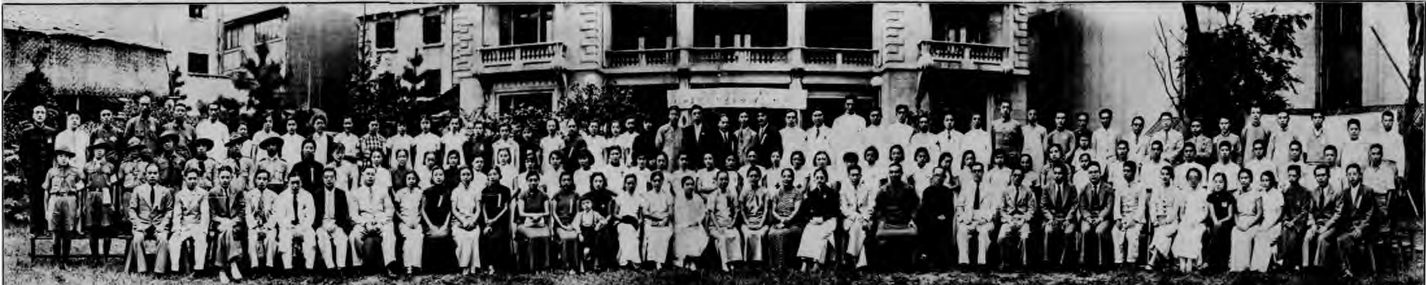
中華民國上海救護委員會主辦 中華婦女互助會 第四十號救護醫院開幕典禮攝影 一九三九年九月十日