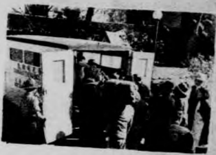
護士休息室之 一隅