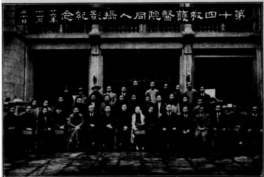
第四十號紅十字醫院同人攝影紀念 二十二年十一月二十日